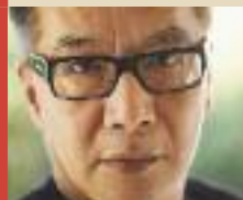
DÔ KHIAM Khmers boléro

Un grand silence suit, dans la pénombre de la salle. »