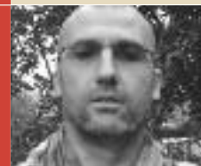
MARC GRACIANO Liberté dans la montagne JOSÉ CORTI En bref :

Première phrase : « Le jour entrain dans une nuit à court d'arguments. »