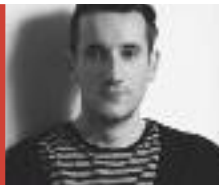
CÔME MARTIN-KARL Les occupations

Anne lcart Blanche apprend que sa fille Violante a accouché d'un petit garçon, alors qu'elle ignorait sa grossesse. Cet événement inattendu est le point de départ d'un voyage dans son histoire familiale, celle de quatre générations de femmes, depuis les années 1950. R. Laffont, 2013 ISBN 978-2-221-12708-7 Br. 20 € env. A paraître : janvier.