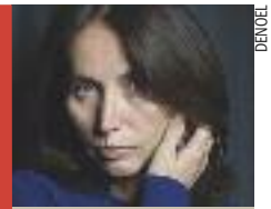
SOLANGE DELHOMME Les traversées DENOËL En bref :

Jean Gab'1 Cette autofiction raconte le destin de Charles, placé en foyer, qui doit attendre sa majorité pour partir à la conquête du Paris des années 1980. Il choisit de participer à des braquages et commence à trouver la capitale française trop petite. Il part pour l'Allemagne pour dévaliser une banque berlinoise, mais il est arrêté et doit purger trente-trois ans de prison, transformés en huit en appel. Don Quichotte éditions, 2013 304 p. ISBN 978-2-35949-085-5 Br. 16 € env. A paraître : janvier.